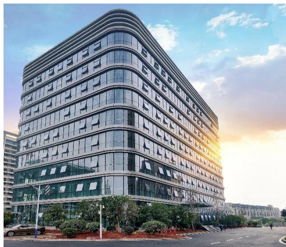
研发中心扩建项目